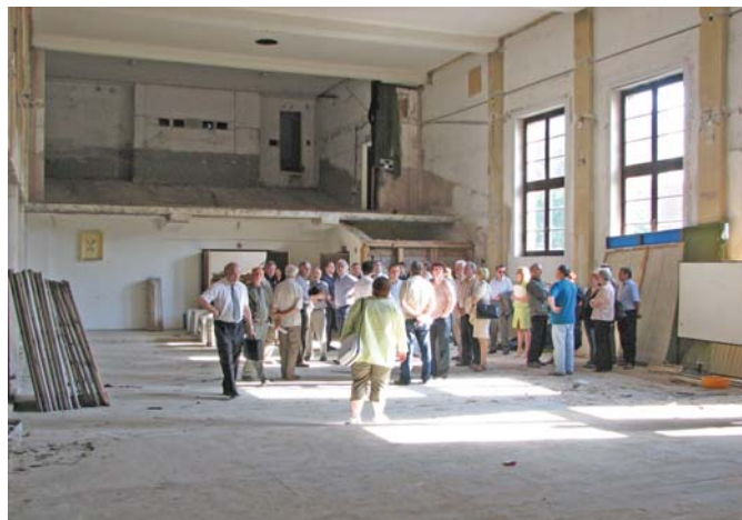
Nabudúce prinesieme informácie o tom, čo zostalo z kina Nádej.

Informácie o organizáciách, ktoré vydávanie novín podporujú, budú vždy uvedené na niektorej zo strán mesačníka. V nultom čísle ste tieto informácie mohli nájsť na ôsmej strane.