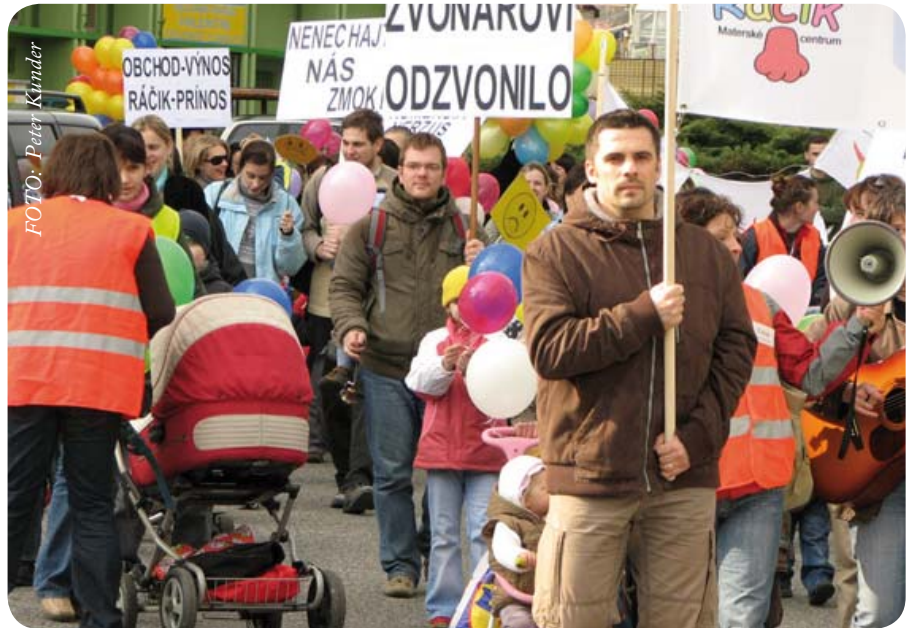
Hrozba, že občianske združenie Ráčik nebude mať kde fungovať, vyhnala do ulíc Račanov s deťmi.

„Stojí vojak na varte, na varte, v roztrha-nom kabáte... Nemá každý perinu,“ spievajú